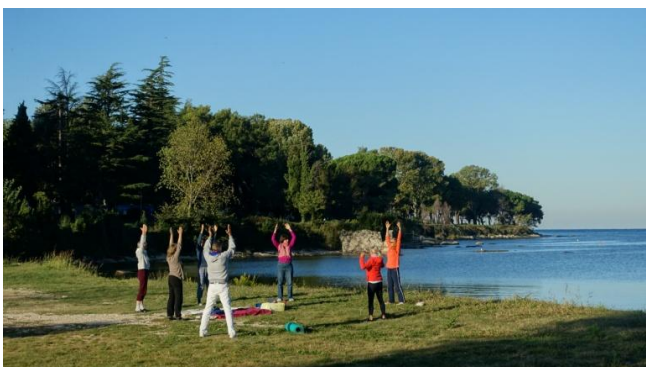
Yoga am Meer